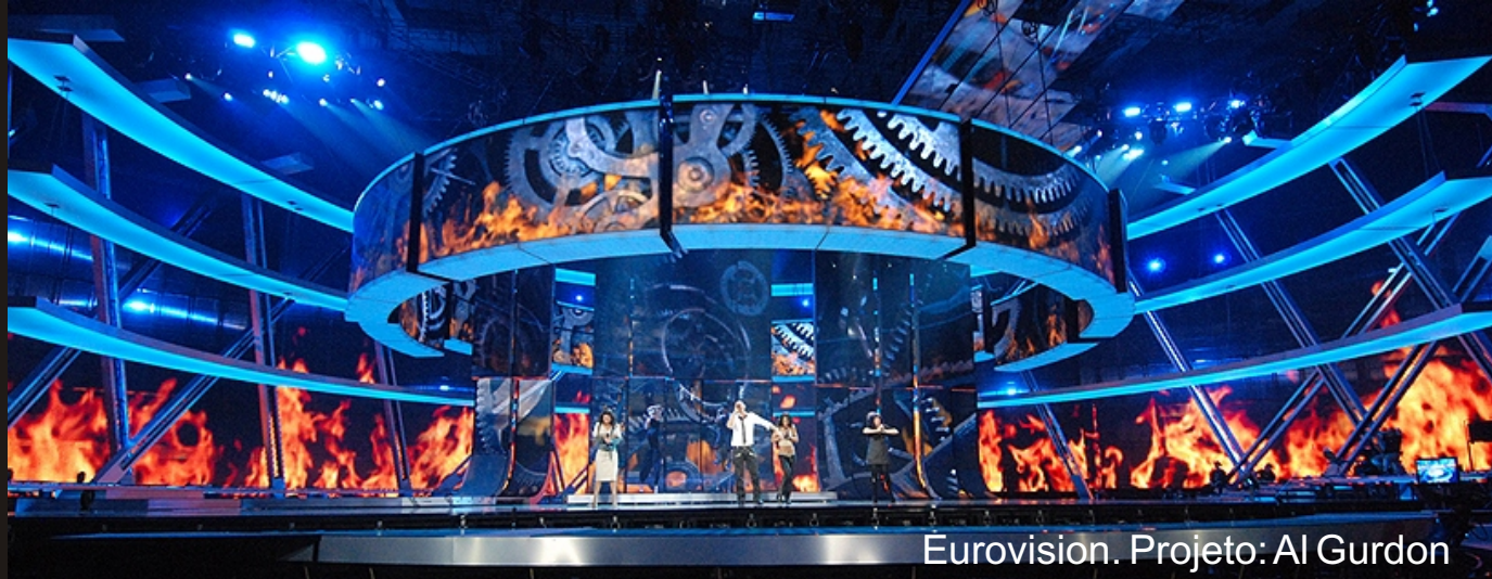
Eurovision. Projeto: Al Gurdon

Os profissionais de Lighting Design podem atuar em vários segmentos do mercado. À seguir, apresentamos algumas delas: