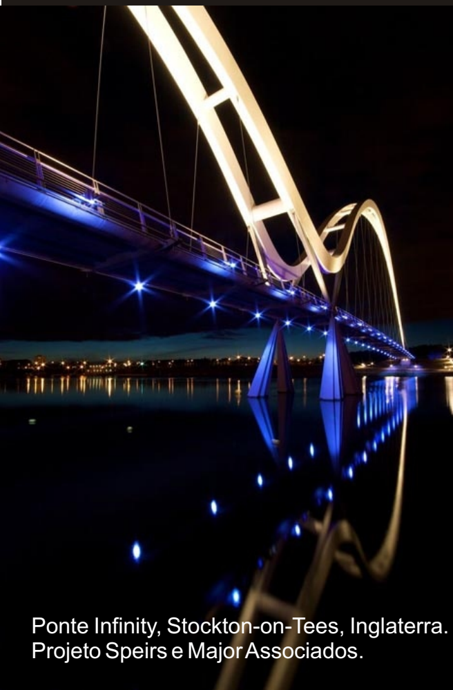
Ponte Infinity, Stockton-on-Tees, Inglaterra. Projeto Speirs e Major Associados.